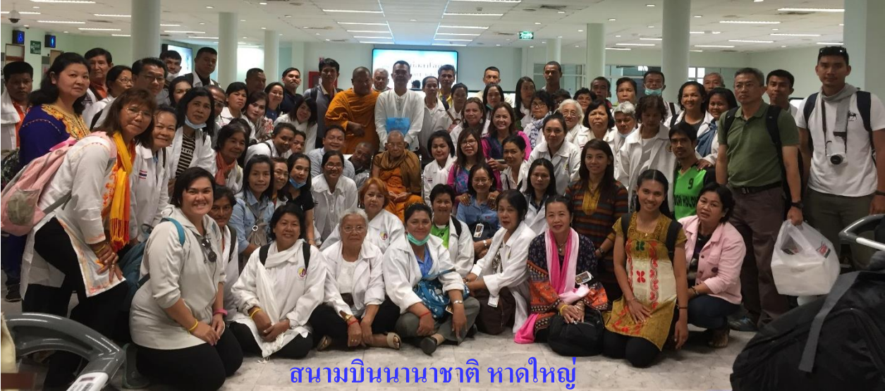
สนามบินนานาชาติ หาดใหญ่

11.15 น.-ถึงสนามบินนานาชาติหาดใหญ่ โดยสวัสดิภาพ+บริการอาหารกล่อง (แพ็คเกจ)+กลับภูมิลำเนา จบโครงการฯ