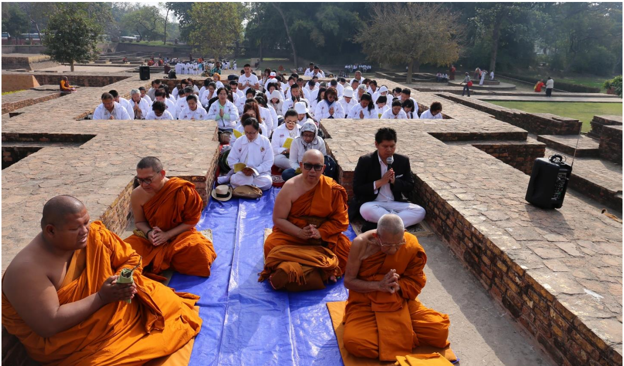
กิจกรรมโครงการฯ : สวดมนต์ เจริญสมาธิภาวนา ณ คันธกุฎี เจดีย์พระอรหันต์ 8 ทิศ : ชมบ้านอนาถบิณฑิกะเศรษฐี