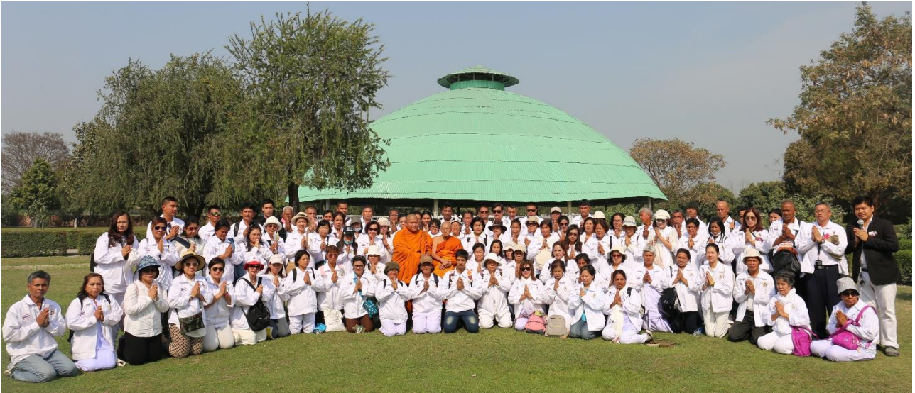
ปาวาลเจดีย์ : สถานที่ทรงปลงอายุสังขาร ในวันเพ็ญขึ้น 15 ค่ำ เดือน 3 (อัมพुकาม ที่ทรงจำพรรษาสุดท้ายที่ 45)