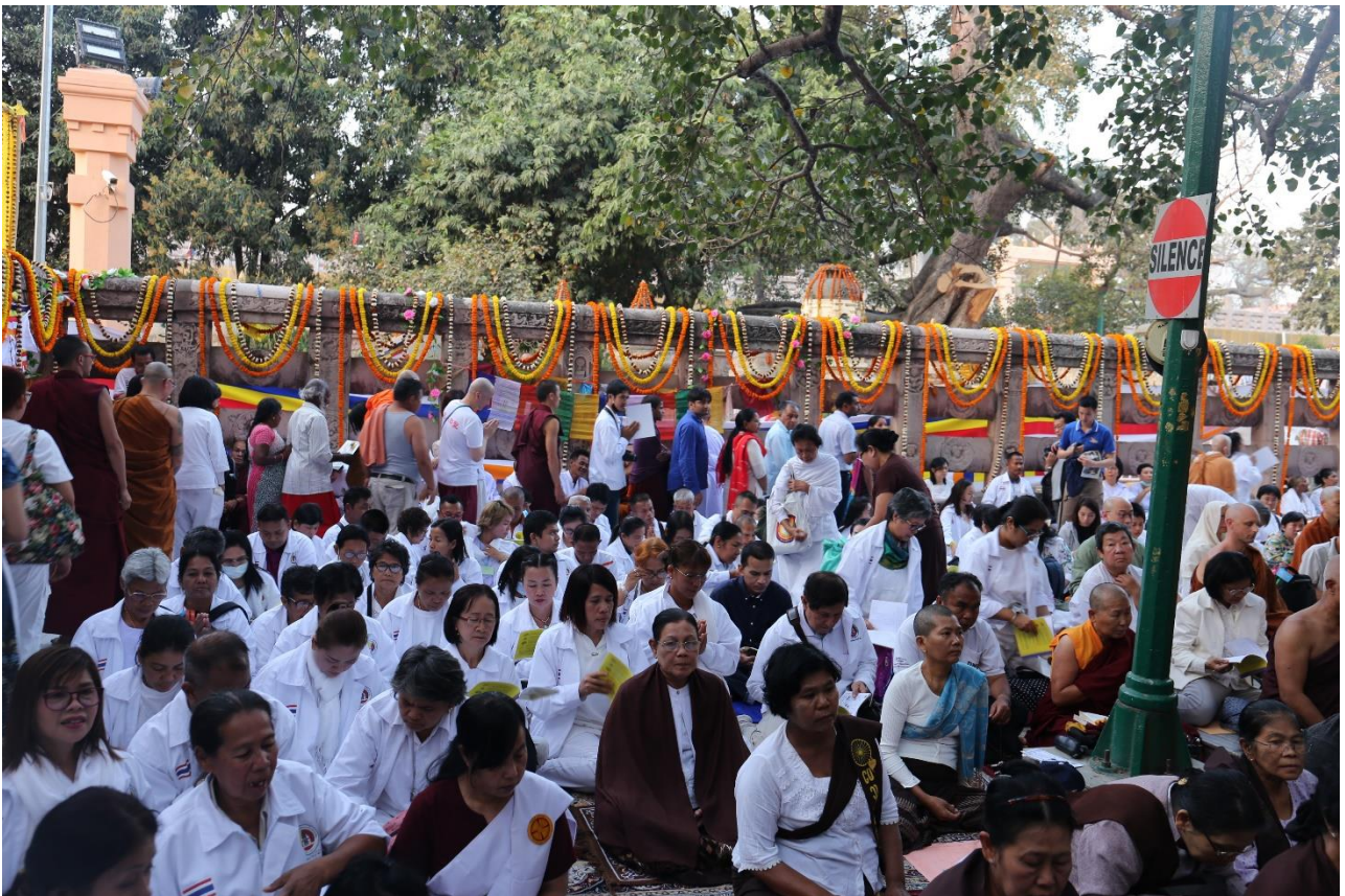
ต้นพระศรีมหาโพธิ์ สถานที่ตรัสรู้ : ปฐมิมินาภิ สะดือของโลก จุดศูนย์กลางของโลก พิธีสวดมนต์ เจริญสมาธิภาวนา