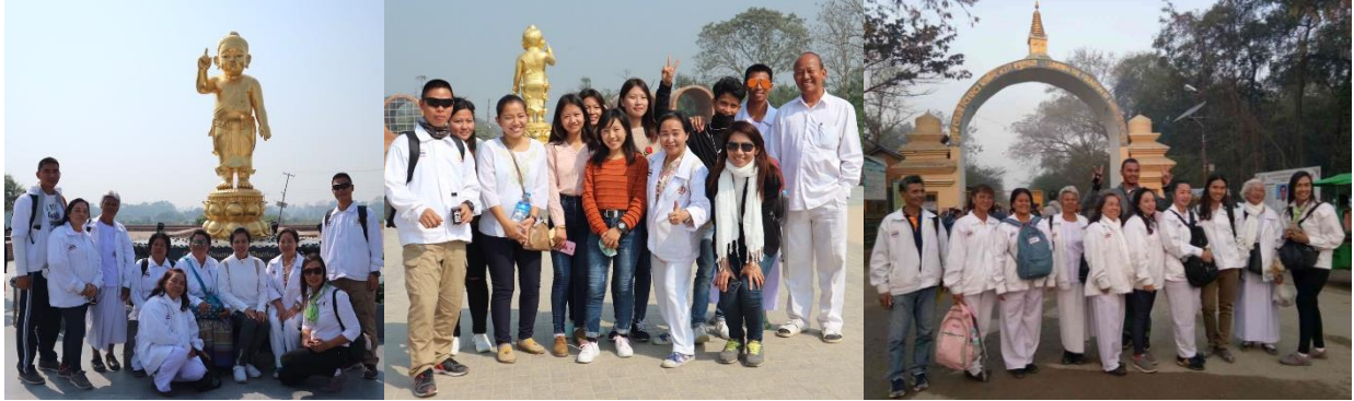
กิจกรรมโครงการฯ : สวดมนต์ทำวัตร เจริญสมาธิภาวนา ณ เสาหินพระเจ้าอโศก-มยาเทวีวิหาร สถานที่ประสูติ