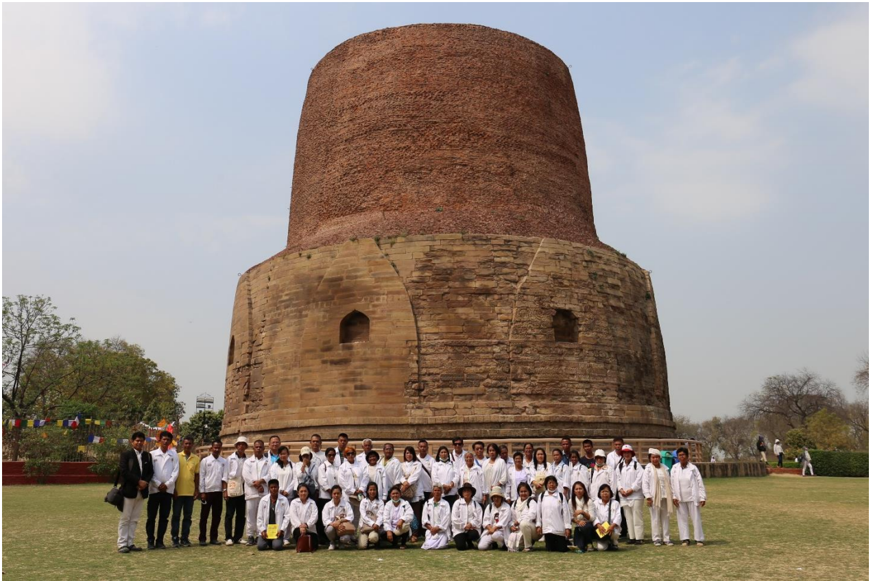
ชมเมฆสถูป : สถานที่แสดงปฐมเทศนา ชมจังกกัปปวัตตนะสูตร ณ ป่าอิสิปตนมฤคทายวัน : สารนาถ พาราณสี