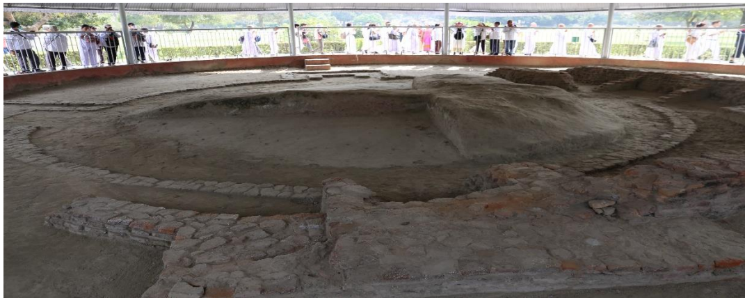
กิจกรรมโครงการฯ : สวดมนต์ เวียนทักษิณวัตร เจริญสมาธิภาวนา ณ ปาวาลเจดีย์ เมืองเวสาลี