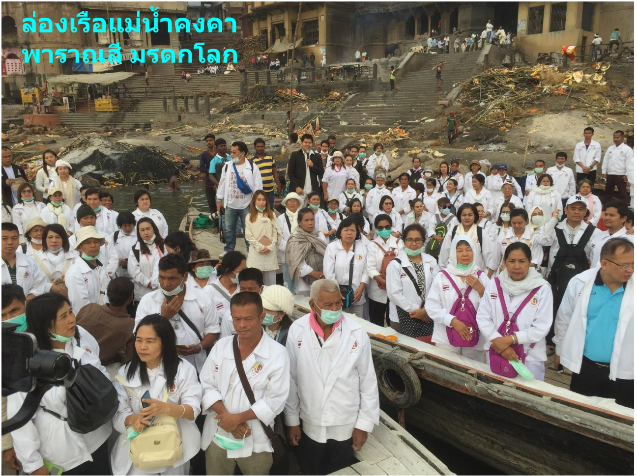
ล่องเรือแม่น้ำคงคา ยาว 2,550 ก.ม. : มณิครรณิกามาต ทำที่เผาศพไฟไม่เคยดับ 4,000 กว่าปี พิธีอาบน้ำชำระล้างบาป