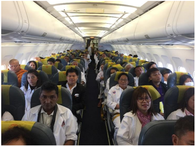
เดินทางจากสุวรรณภูมิ สู่พุททคยา ประเทศอินเดีย โดยสายการบิน BHUTAN AIRLINES (แบบเช่าเหมาลำพิเศษ)