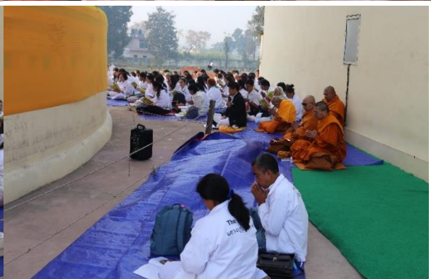
กิจกรรมโครงการฯ : พิธีสวดมนต์ เจริญสมาธิภาวนา ถวายผ้าห่มองค์พระพุทธรูปปรินิพพาน ณ สถานที่ปรินิพพาน