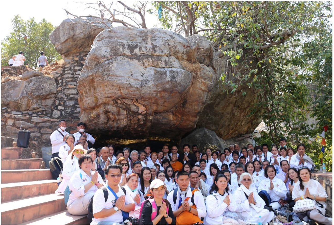
ราชคฤห์ : เขาคิชฌกูฏ สวตมนต์เจริญสมาธิ ณ พระมูลคันธกุฎี-ถ้ำพระสารีบุตร-พระมหาโมคคัลลานะ-วัดเวฬุวัน

วันที่แปด : พุทธคยา-ราชคฤห์ เขาคิชฌกูฏ-วัดเวฬุวัน-มหาวิทยาลัยนาอันทา-หลวงพ่อดำ อังคาร 6 มี.ค. 61