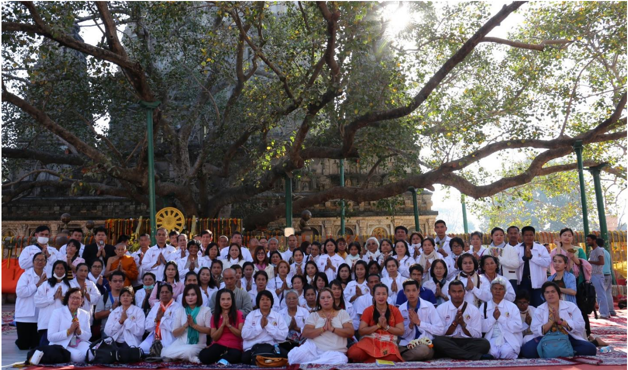
กิจกรรมโครงการฯ : สวดมนต์ปฏิบัติธรรม เจริญสมาธิภาวนา เวียนทักษิณาวัตร ณ ต้นพระศรีมหาโพธิ์