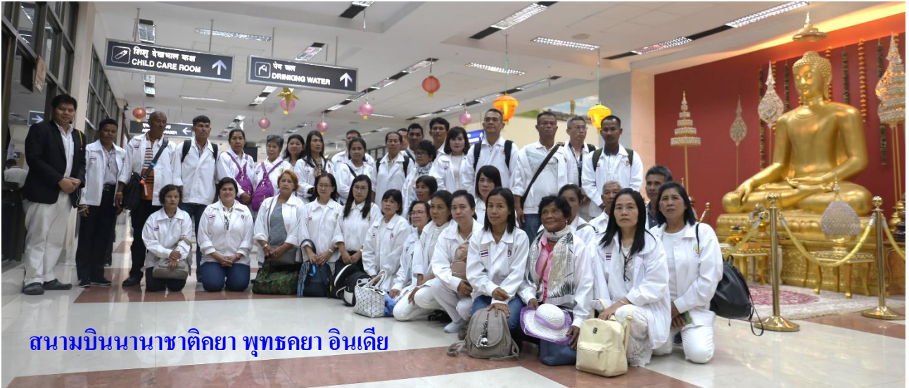
สนามบินนานาชาติคยา พุทธคยา อินเดีย

สุชาติสาธูป : สธูปบ้านนางสุชาติ ผู้ถวายข้าวมธุปายาสแด่พระมหานรุษโพธิสัตว์ลัทธิตถะ ตำบลอุรุเวลาเสนานิคม