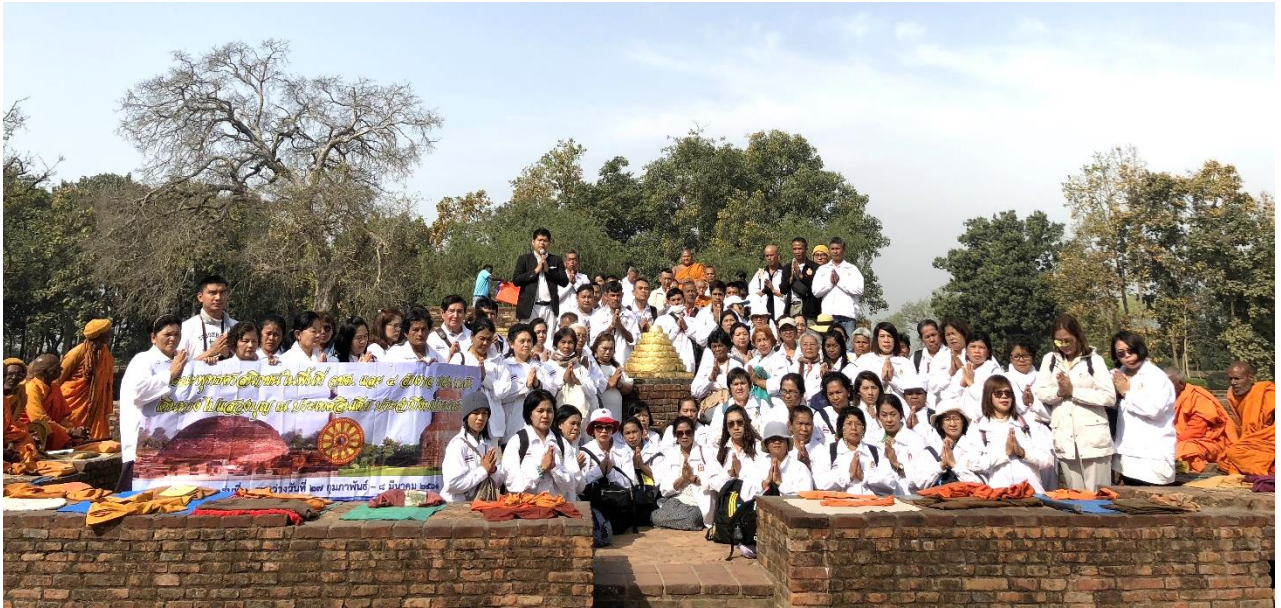
วัดเชตวันมหาวิหาร สถานที่ประทับอยู่นาน 19 พรรษา : สาวัดดี 25 พรรษา (เชตวัน 19+บุพพาราม 6 = 25 พรรษา)