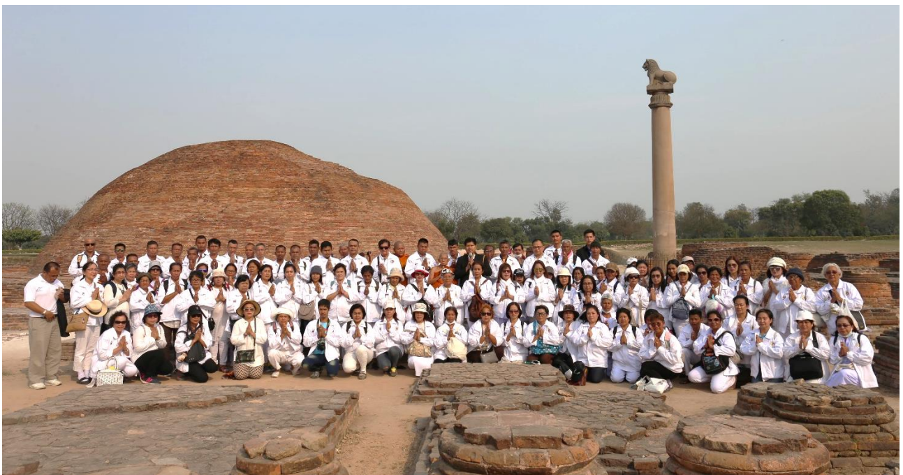
วัดป่ามหาวัน : สถานที่เกิดขึ้นแห่งภิกษุณีสงฆ์ครั้งแรกของโลก (สถานที่ทรงจำพรรษาที่ 5) เมืองเวสาลี แคว้นวัชชี