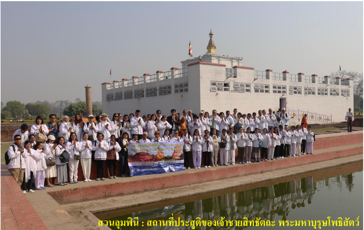
สวนลุมพินี : สถานที่ประสูติของเจ้าชายสิทธัตถะ พระมหาบุรุษโพธิสัตว์

วันที่หก : ลุมพินี (เนปาล) เสาหินอโศก-มายาเทวีวิหาร-สระโบกขรณี -สาวัตถี (อินเดีย) เสาร์ 3 มี.ค. 61