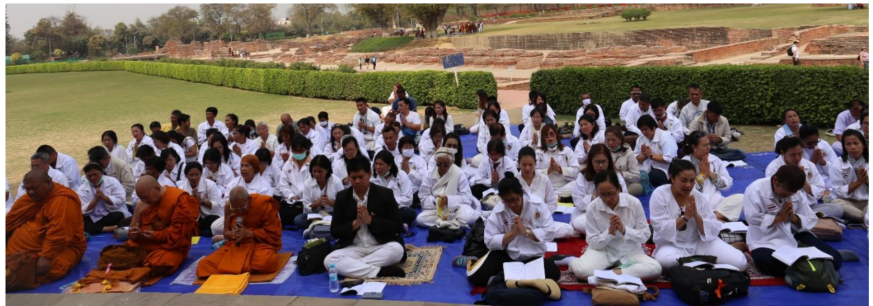
กิจกรรมโครงการฯ : สวดมมตักกัวัตร เจริญสมาธิภาวนา สาธยายพระจัมมจักกัปปวัตตนะสูตร ณ ชมเมฆสถูป