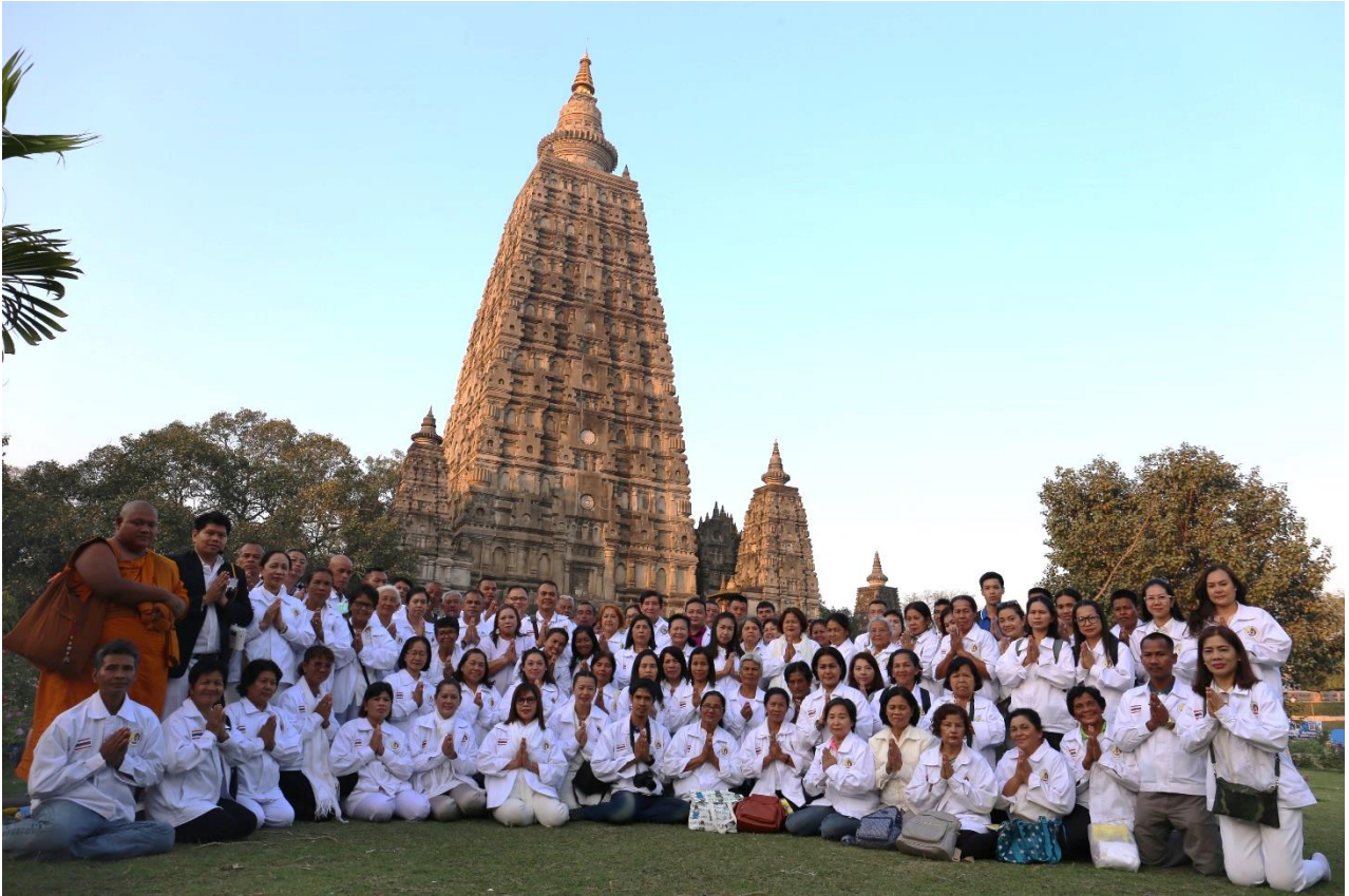
เจดีย์พุทธคยา : อนุสรณ์แห่งการตรัสรู้ สร้างโดย พระเจ้าโสภณมหาธา พ.ศ.254, พระเจ้าหุวิษกะ ต่อเติม พ.ศ.674