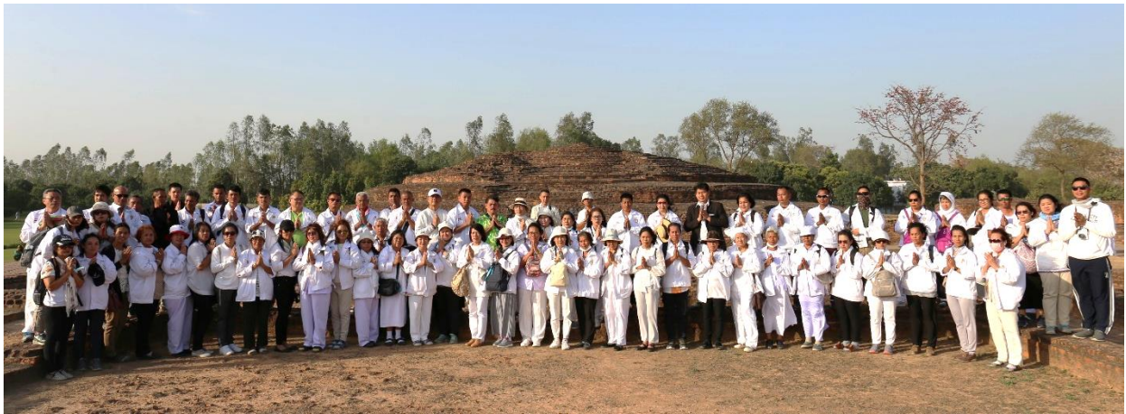
กบิลพัสดุ์ : สถูปเจดีย์ที่ค้นพบพระบรมสารีริกธาตุแห่งนี้ ไทยได้รับส่วนแบ่งมาบรรจุไว้ที่เจดีย์ภูเขาทอง กทม.